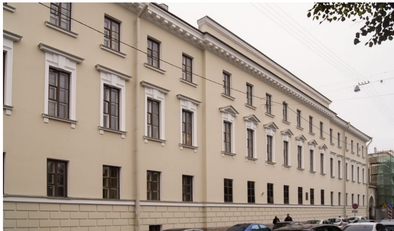
Комплекс зданий Аничкова дворца. Конюшни. С-П, набережная реки Фонтанки, д.33

Актуально применение силикатных красок в помещения, к отделке которых предъявляются повышенные требования по пожарной безопасности. В 2012 году в вестибюле метро «Автово» компания «АЖИО» проводила работы по воссозданию подвесных кессонов из стеклофибробетона на потолке. Окраску осуществляли с помощью силикатных красок.