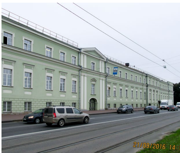
Императорский Фарфоровый Завод. С-П, пр. Обуховской обороны, д. 151