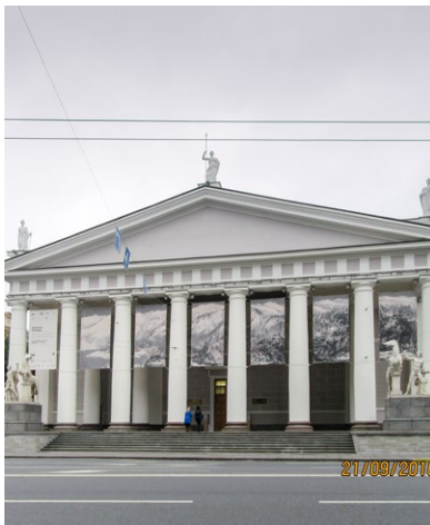
Манеж С-П, Исаакиевская пл., д.1