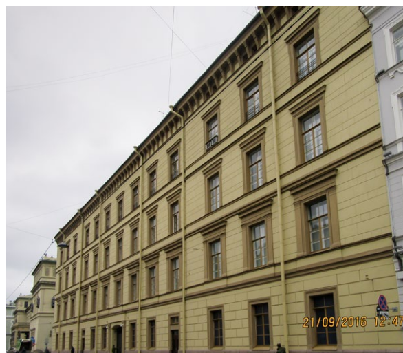
С-П, ул. Миллионная, д.33