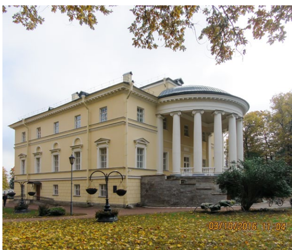
Дача Кочубея. г. Пушкин, ул. Садовая, д.22

В этом году мы осмотрели более десятка объектов, окрашенных в разное время. На фотографиях приведены некоторые из них. Так здание Дворцовой телеграфной станции в Петергофе было окрашено в 2009 году. Императорский Фарфоровый завод и Дача Кочубея (г. Пушкин) – в 2011 году. В 2012 году окрашены корпуса 12 и 12А больницы Мечникова. Фасад здания на Миллионной улице, д. 33. был окрашен в 2014 году. В 2015г в ходе реставрации комплекса зданий Аничкова дворца силикатной краской «Рунит» окрашены Конюшни. В 2015-2016гг произведена окраска Манежа на Исаакиевской площади. Все здания по прошествии времени имеют хороший эстетический вид.