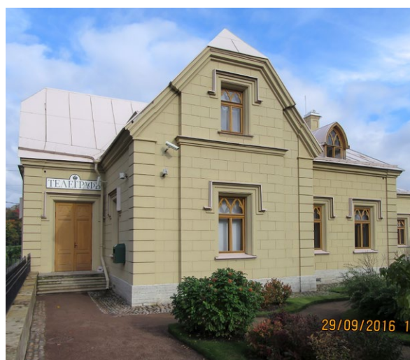
Дворцовая телеграфная станция. Петергоф. Санкт-Петербургский пр., д.3