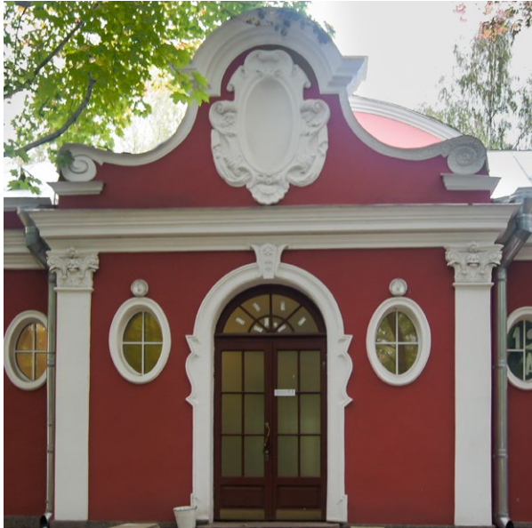
Больница Мечникова корпуса 12А и 12 С-П, Пискаревский пр., 47